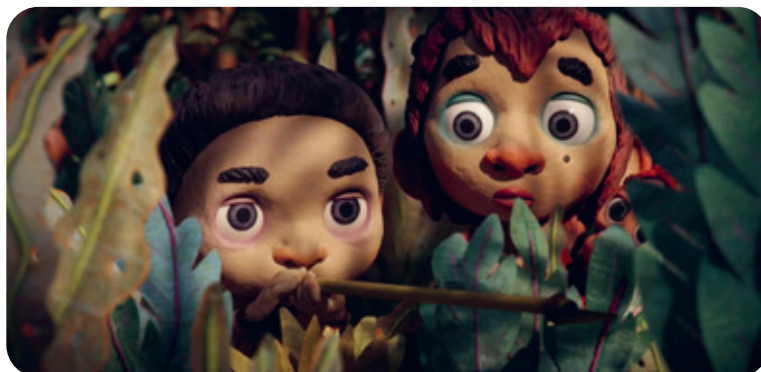
Selai gant e strinkerez

Chaseal a reont dreist-holl gant ur strinkerez, a vann biroù ampoezonet (ar poezon a zo sabr ur wezenn).