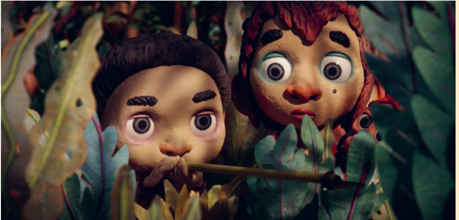
Selaï gant e strinkerez

Chaseal a reont dreist-holl gant ur strinkerez, a vann biroù ampoezonet (ar poezon a zo sabr ur wezenn).